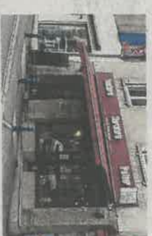
Une enseigne de Port-sur-Saône.

Parmi les principaux axes de réflexion figure la transition énergétique (travaux prévus dans les écoles et la salle SaôneExpo). Le développement économique et touristique n'est pas mis de côté : « Une action